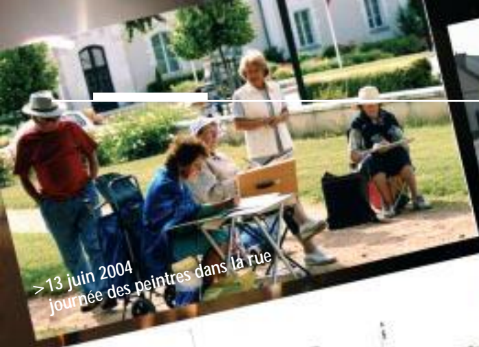
> 13 juin 2004 journée des peintres dans la rue