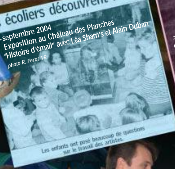
Les enfants ont posé beaucoup de questions sur le travail des artistes.