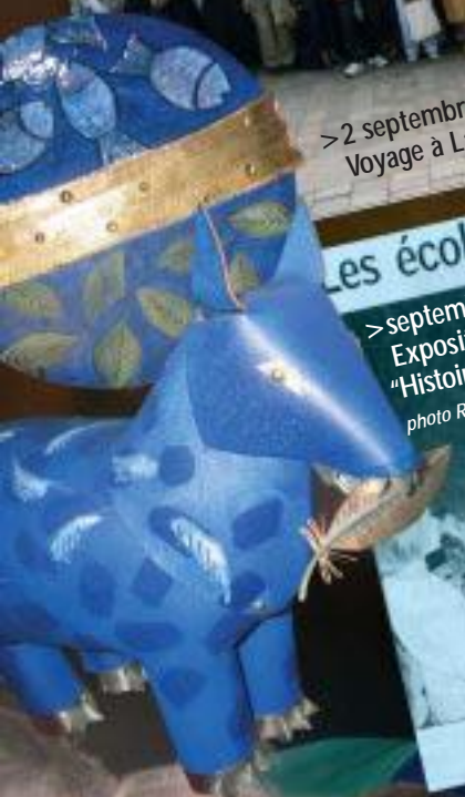
> septembre 2004 Exposition au Château des Planches "Histoire d'émail" avec Léa Sham's et Alain Duban photo R. Perot NR