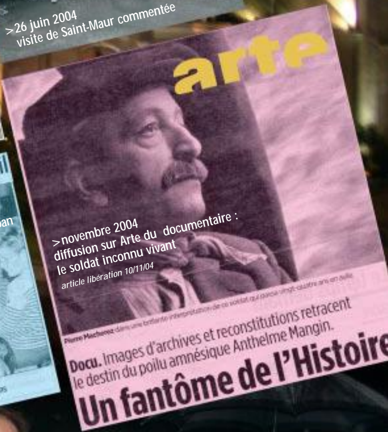
> novembre 2004 diffusion sur Arte du documentaire : le soldat inconnu vivant article liberation 10/11/04