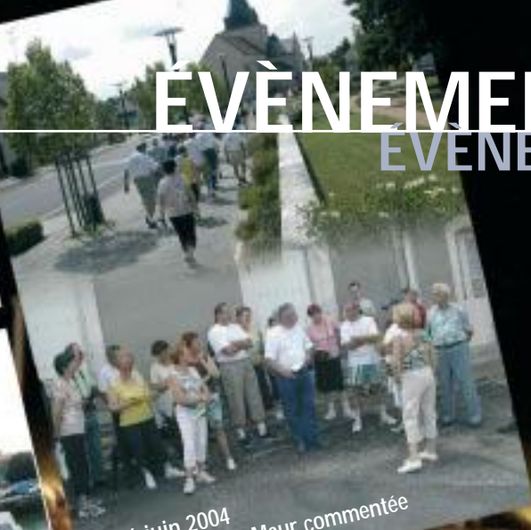
> 26 juin 2004 visite de Saint-Maur commentée