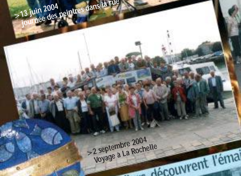
> 2 septembre 2004 Voyage à La Rochelle