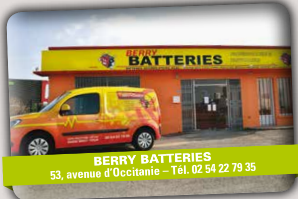
BERRY BATTERIES 53, avenue d'Occitanie – Tél. 02 54 22 79 35