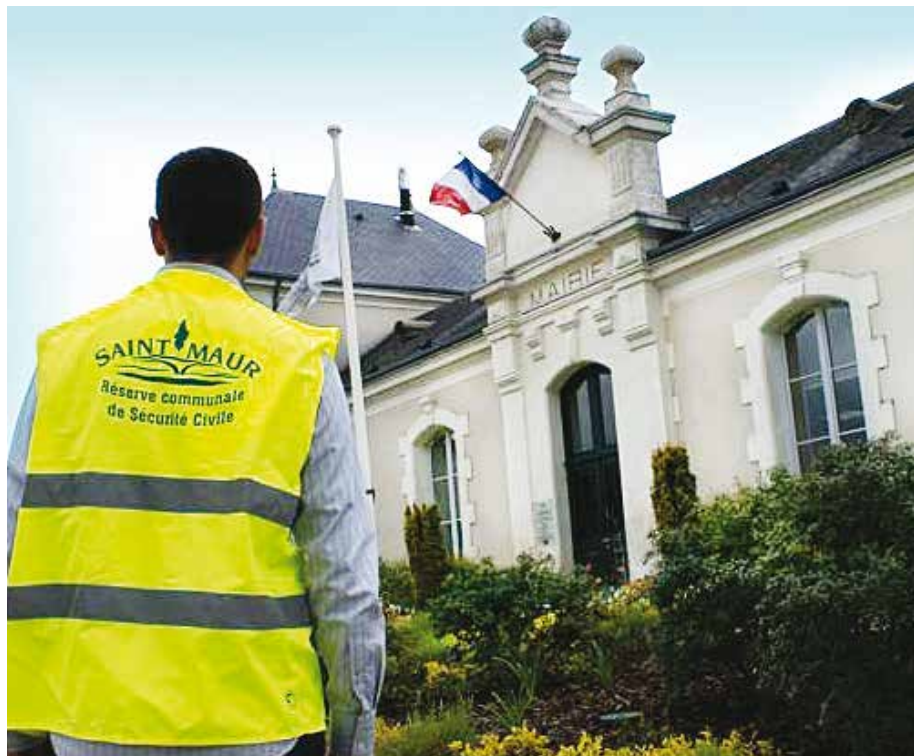
La réserve communale est composée de bénévoles

Créée en décembre 2007, par délibération du conseil municipal, la Réserve Communale de Sécurité Civile a été mise en place dans la continuité du plan communal de sauvegarde. Sous l'autorité François Jolivet, celle-ci a pour fonction d'appuyer les différents services concourant à la sécurité civile comme la Police, les sapeurs-pompiers, le Samu... Elle intervient en cas d'événements nécessitant des moyens complémentaires mais ne se substitue en aucun cas aux services de secours.