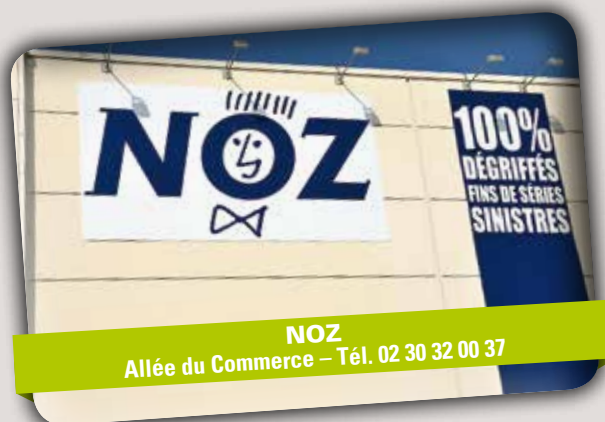
NOZ Allée du Commerce – Tél. 02 30 32 00 37