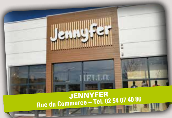
JENNYFER Rue du Commerce – Tél. 02 54 07 40 86