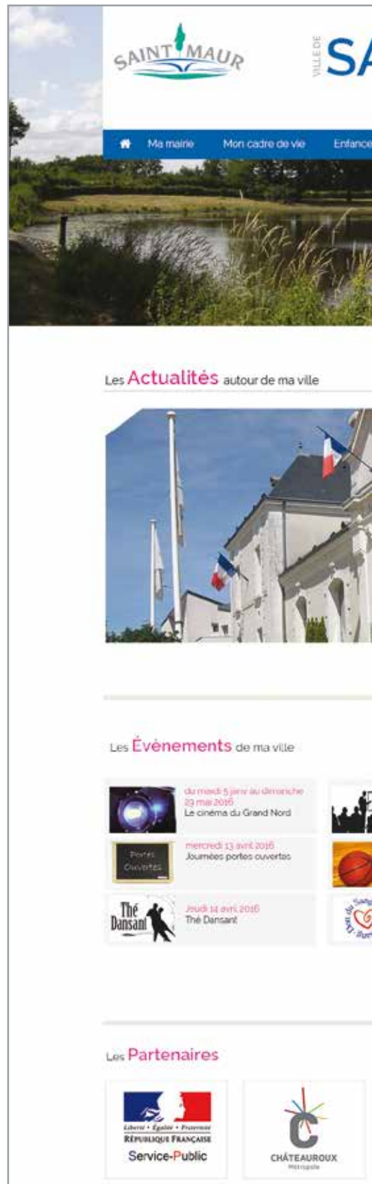
La Page d'accueil du site en cours de réalisation

Une application mobile (IOS, Android) viendra compléter ce nouveau site permettant de nombreuses actions comme : annuaires dynamiques, actualités, gestion des demandes auprès de la mairie.