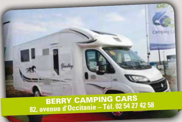
BERRY CAMPING CARS 82, avenue d'Occitanie – Tél. 02 54 27 42 58