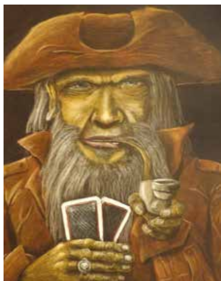
Le joueur de carte par Pierre Loïs Damien Etiève

tants ayant proposé l'idée. Il peut s'agir de tricots, crochet, origami, bijoux, cartonage, etc. Toutes les idées sont les bienvenues. L'aspect interactif ou participatif de la proposition étant le premier critère.