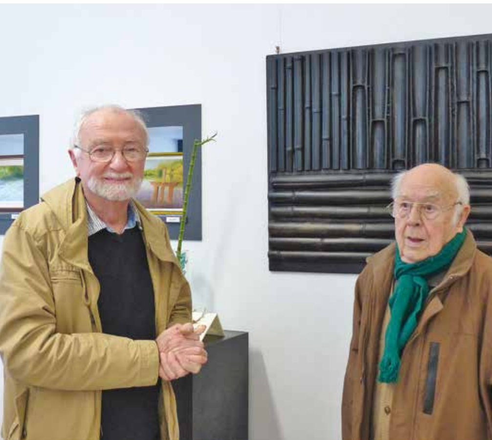
Des artistes saint-maurois talentueux