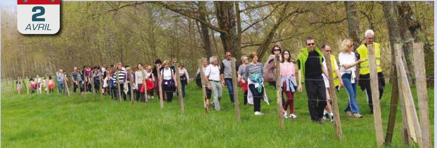
Randonnée fromagère de l'USSM Marche.