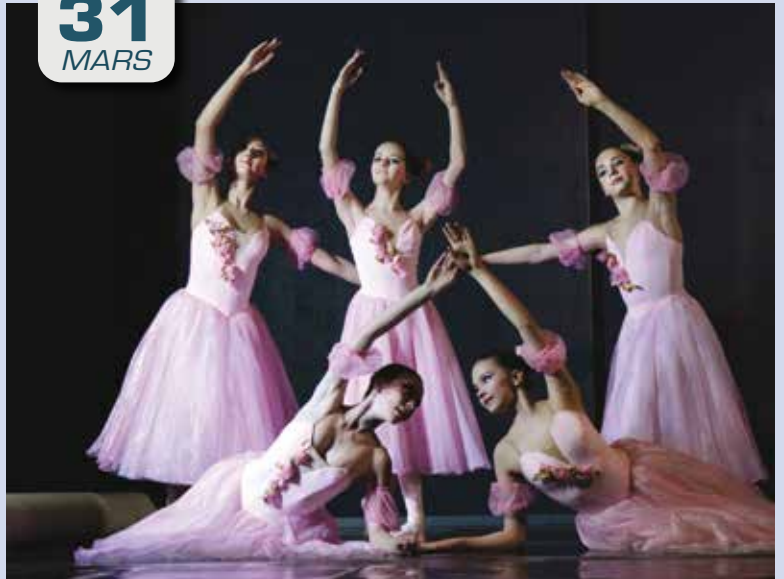
Sppectacle de l'école impériale des ballets russes de Saint-Petersbourg.