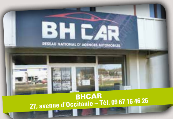
BH CAR 27, avenue d'Occitanie – Tél. 09 67 16 46 26