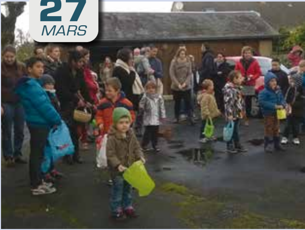
Villers-les-Ormes. Chasse aux œufs.