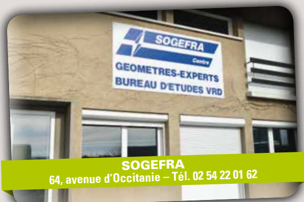
SOGEFRA 64, avenue d'Occitanie – Tél. 02 54 22 01 62