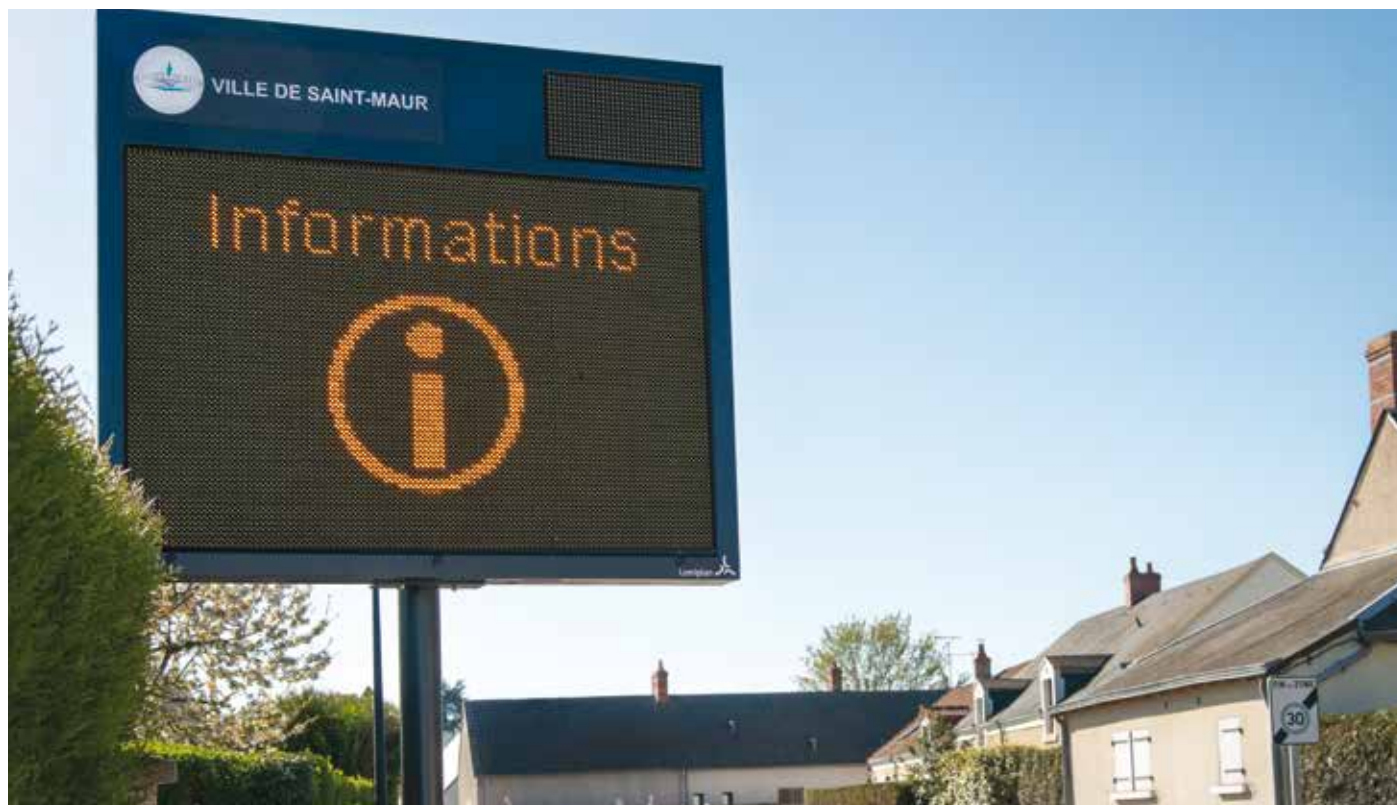
Le nouveau panneau d'affichage de Villers-les-Ormes